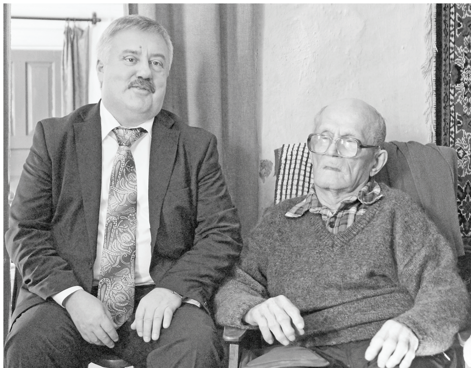
Фото на память в день юбилея.