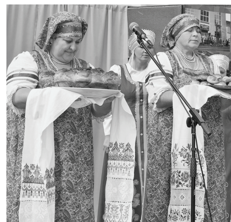
На сцене - культработники с.Маклаки.

Грант в 100 тысяч рублей завоевал Маклаковский сельский Дом культуры по ре-