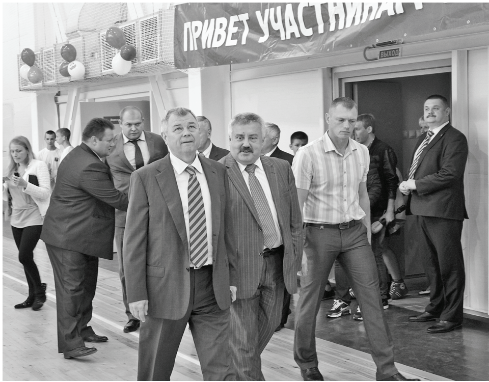
В новом спорткомплексе «Заря».

Работа центральной районной больницы стала предметом пристального внимания областного Минздрава, которому больница подведомственна и подотчетна. Устранение проблем - дело профессиональной компетенции администрации ЦРБ и находится на контроле министерства. Надеюсь, что усилия специалистов дадут результат, и жители района будут удовлетворены качеством медицинских услуг.